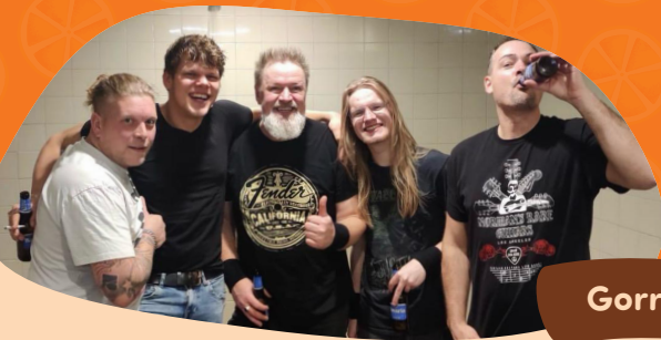
Gorro & Zn

Voor deze avond is er kaartverkoop. Een kaart kost €15 exclusief servicekosten. De afgelopen jaren waren alle kaarten snel uitverkocht, dus wacht niet te lang!