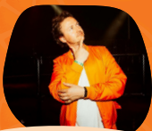
Your Good Guy

De dames en heren van het Open Veens kampioenschap komen niet alleen met hun arena en mooie aankleding, maar vooral met bakken enthousiasme en bravoure. Flunkyball is hét spel waarbij twee teams de strijd aangaan in een sfeervolle arena, aangemoedigd door enthousiaste publiek. Het belooft een Koningsnacht vol spektakel, lachen, juichen én vooral veel plezier te worden.